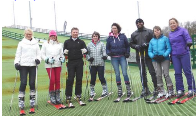
*Groep skiërs van Gelderse Vallei op de baan in Huizen.

Voor degenen die niet meegaan, komt er in de week van februari een vervangende SneeuwFit-les, waarbij misschien enkele groepen/uren gecombineerd worden. Daarover volgt begin februari meer informatie.