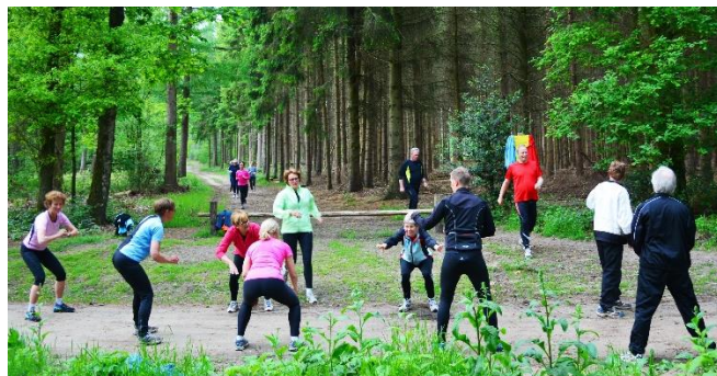
*ZomerFit met afwisselend spieroefeningen en looptraining.

Op donderdagavond 31 maart 19.30 uur begint het ZomerFit-seizoen in het bosgebied De Sijselt in Ede. Je kunt daar met allerlei spieroefeningen op het gebied van rekken, strekken, kracht, coördinatie, evenwicht en vaardigheid en enige looptraining onze in de zaal opgebouwde conditie en uithoudingsvermogen op peil houden en verder versterken. Een redelijk aantal SneeuwFit'ers heeft zich al aangemeld en wil lekker sportief bezig blijven, buiten in de natuur. Maar er is nog plaats voor veel meer belangstellenden. Heb je niet eerder aan ZomerFit meegedaan, dan is eerst een proefles een prima optie. Het seizoen ZomerFit duurt tot en met 30 juni. Die 13 lessen kosten maar 51 euro. Als dit je 2 e activiteit is dit seizoen ontvang je 4 euro korting. Op 5 mei is er geen les; vanaf 12 mei wordt om 20.00 uur begonnen. Een aanrader! Meld je aan via het formulier "Direct aanmelden" op www.skigeldersevallei.nl of per mail. Meer info bij onze secretaris.