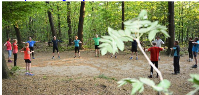
*De spieren los maken aan het begin van een uur ZomerFit....